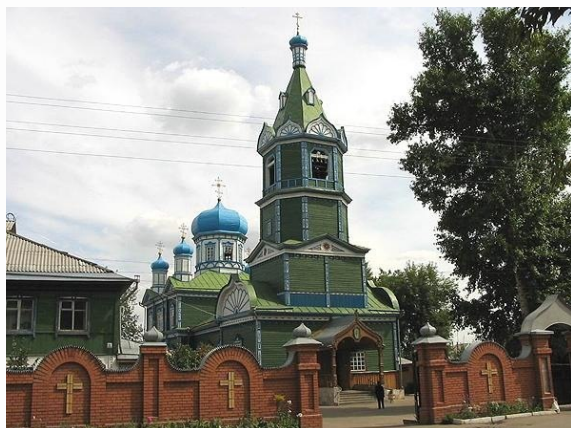
Епархиальное Управление Рубцовской и Алейской епархии Алтайской митрополии 658224, Алтайский край, г. Рубцовск, ул. Советская, д.9

РУБЦОВСКАЯ ЕПАРХИЯ АЛТАЙСКОЙ МИТРОПОЛИИ РУССКОЙ ПРАВОСЛАВНОЙ ЦЕРКВИ (МОСКОВСКИЙ ПАТРИАРХАТ)