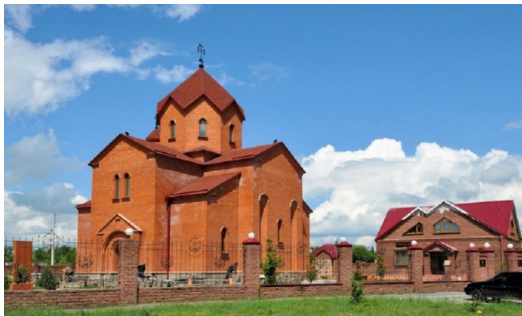
656067, Алтайский край, г. Барнаул, ул. Попова, 210

МЕСТНАЯ РЕЛИГИОЗНАЯ ОРГАНИЗАЦИЯ ЦЕРКОВЬ "СУРЬ РИПСИМЕ" (СВЯТОЙ РИПСИМЕ) ГОРОДА БАРНАУЛА АЛТАЙСКОГО КРАЯ (РОССИЙСКОЙ И НОВО- НАХИЧЕВАНСКОЙ ЕПАРХИИ) СВЯТОЙ АРМЯНСКОЙ АПОСТОЛЬСКОЙ ПРАВОСЛАВНОЙ ЦЕРКВИ